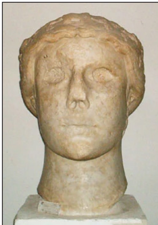
fig. 4 - Capua fidelis (cosiddetta), Capua, Museo Provinciale Campano.

resto del primo nel 1249), dall'altro è credibile una stratificazione tipologica: Federico e i suoi due collaboratori rappresentano cioè il presente, antitipo di tipi cristiani. In quest'ottica, il più diretto parrebbe la Trasfigurazione, con Gesù fra Mosè ed Elia, il che implicherebbe rimandi sia all'Antica e Nuova Legge sia al netto rifiuto dell'idolatria (tema della successiva propaganda papale anti-imperiale). Ma se vale il principio, allora la stessa immagine imperiale vede Federico quale antitipo di molti tipi, da quelli biblici (Davide, Salomone, Giosia,