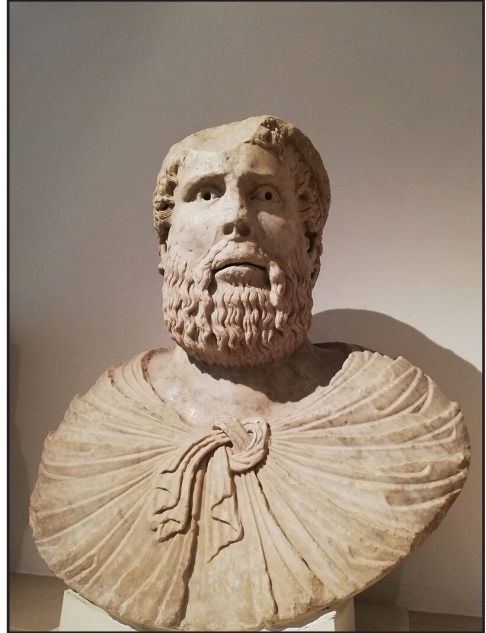
fig. 3 - Pier della Vigna (cosiddetto), Capua, Museo Provinciale Campano.

Qui s'inserisce un altro tema, che ha dato origine a letture a volte singolari dei personaggi: l'identificazione cioè dei due busti clipeati nei ritratti di Pier della Vigna e Taddeo di Sessa. Al di là del ruolo in effetti eminente dei due alti funzionari, stupisce la loro presenza così enfatizzata e duratura. Se da un lato l'antichità della tradizione identificativa la rende plausibile (e colpisce comunque l'assenza di damnatio dopo l'ar-