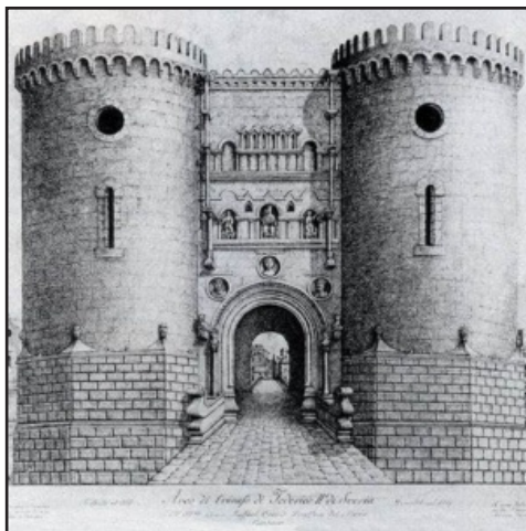
fig. 1 - Incisione raffigurante la Porta delle Torri di Capua.

Spesso è stata rilevata la multipla funzione iconologica della struttura: porta fisica e simbolica del Regnum rivolta, non senza fini polemici, verso il Patrimonium Petri ; ingresso ad una città nodale e luogo di dispensazione della giustizia (secondo un parametro simbolico di radici bibliche); introito all' Imperium Caesaris visto nella sua dimensione di ipotiposi della Gerusalemme Celeste. Minore attenzione è stata prestata al preciso contesto cronologico della fondazione nel 1234, fortemente voluta dal sovrano anche in termini di brutali espropri e rapidità edilizia. Dopo l'accordo di Anagni del 1231 – che poneva fine momentanea alla lotta contro Gregorio IX e dava origine in Roma stessa all'iconografia 'davidica' di Federico 4 –, lo stesso anno vede una serie di eventi: la dieta di Ravenna (e la scelta del luogo non pare banale) che ripone in termini giuridici il tema della sottomissione dei Comuni settentrionali; la coniazione dell'augustale, forse la massima codificazione ideologica del classicismo imperiale federiciano ma anche l'immagine della riorganizzazione economica; l'emanazione del Liber augustalis , parallela codificazione giuridica e amministrativa. La rivolta del figlio Enrico nel 1234, al di là dei suoi tragici risvolti, segna comunque il permanere dei buoni rapporti col pontefice (che scomunica il ribelle) e la solidità del potere federiciano in Germania. Credo anzi che uno dei valori