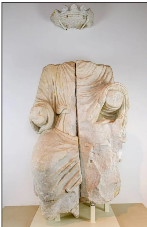
fig. 2 - Federico II, Capua, Museo Provinciale Campano.

riciana. La lettura è più complessa alla luce di due altri eventi del 1234: l'appoggio al filoalbigese Raimondo VII di Tolosa (in contrasto quindi con Luigi IX di Francia e suo suocero Raimondo Berengario IV di Provenza) e l'ambiguo sostegno al papa nella lotta contro i Savelli; due segnali cioè di quelle incrinature che porteranno alla battaglia di Cortenuova (1237) e alla nuova scomunica contro l'imperatore (1239). In altre parole, la Porta può avere certo subito evoluzioni iconografiche col mutare della situazione, ma alla sua fondazione il clima non è di contrapposizione, come talvolta sostenuto, ma di collaborazione con la Chiesa. Dunque, l'imperatore (la cui statua è certamente nodale nell'iconografia) è anzitutto il rex iustus sullo schema davidico-salomonico, nel duplice senso di fonte veritativa del diritto e di fedele osservante